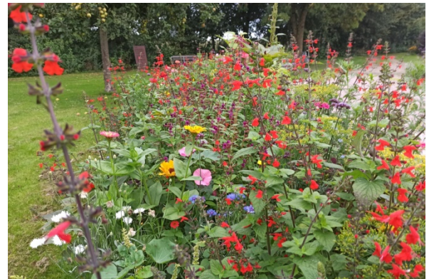
Foto 4: Alle planten kregen steun van elkaar en stonden daardoor stevig, ook bij harde wind.