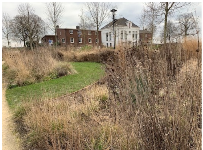
winter in de vlindertuin

Edwin zal ons rondleiden en jullie vragen beantwoorden.